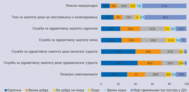
Графикон 1. Процена сарадње са службама унутар дома здравља